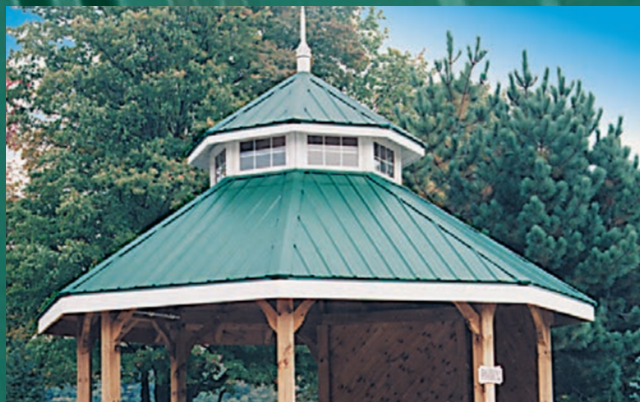
COMMERCIAL ET INDUSTRIEL LÉGER