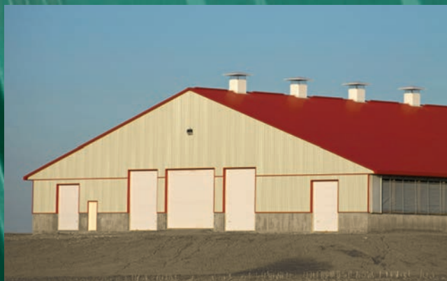
AGRICOLE ET APPLICATIONS INTÉRIEURES