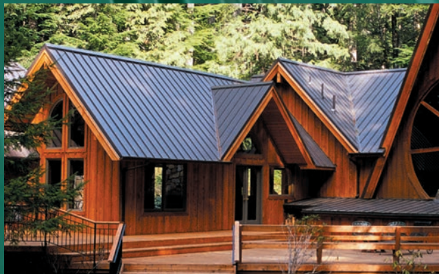
RÉSIDENTIEL ET CHALET